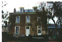
Un logement locatif « PST » rue du Val de Loire à Azé